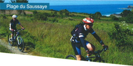
Plage du Saussaye